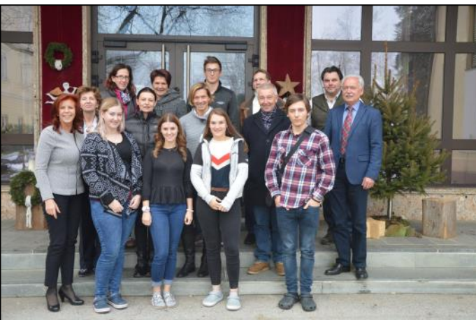
Schulgemeinschafts - Ausschuss - Mitglieder des Bildungszentrums Ehrental

... dient der Förderung und Festigung der Schulgemeinschaft und hat Beratungs- und Mitbestimmungsrecht über verschiedenste Belange in Unterricht und Erziehung.