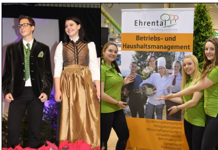
Auf der Messe als Modell am Laufsteg, oder für das kulinarische Verwöhnprogramm zuständig - EhrentalerInnen bewähren sich immer!