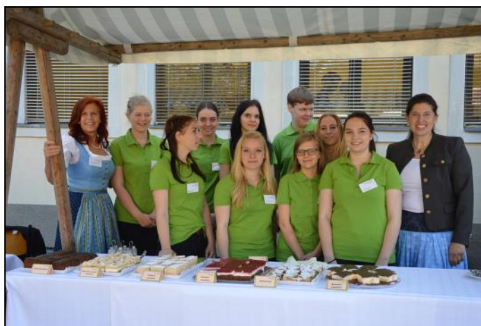
Wie gewohnt lies man sich auch am Tag des Gartens 2017 von den SchülerInnen der Fachrichtung Betriebs- und Haushaltsmanagement kulinarisch verwöhnen.