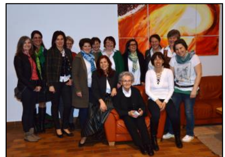
Jubiläumsjahrgänge genießen die gemeinsame Zeit