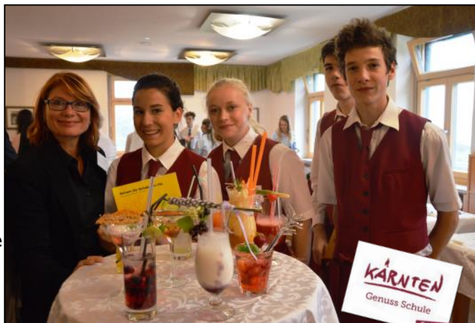
„Chics Mix“ und andere coole Getränke beim Cocktailwettbewerb