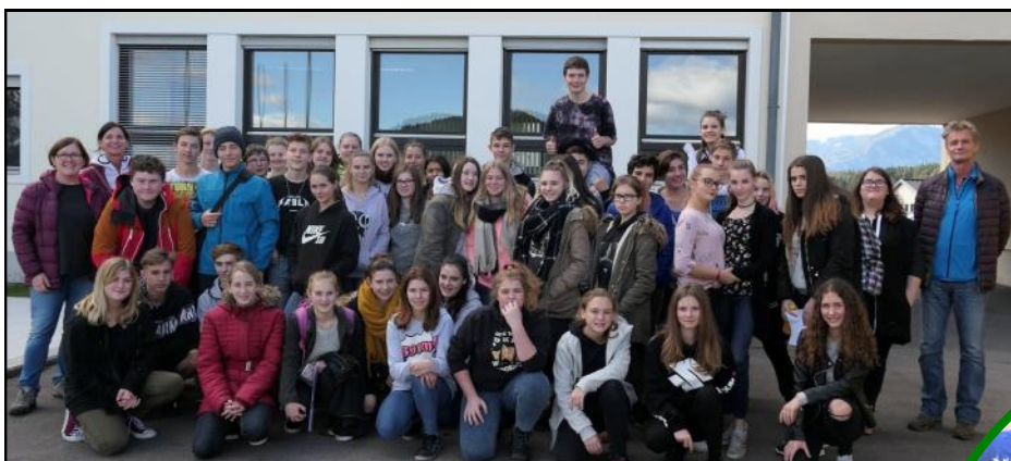
IA und IB 2017/2018 lernen sich kennen.

Gemeinsam können wir auch in diesem Jahr nicht nur Berge Versetzen, sondern auch hin und wieder Luftschlösser bauen!